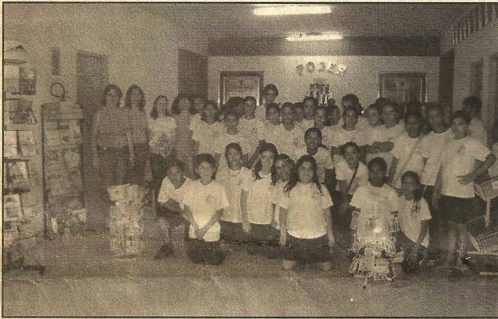
Alunos da escola Isabel Alves Lima visita a Feira do Livro